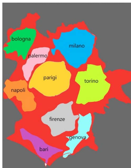
Fig. 1. La dimensione amministrativa di Roma.

A Milano le mappe del NIL dovrebbero essere periodicamente aggiornate in base a quanto previsto dalla direttiva che istituisce il servizio. Secondo una tesi di laurea del Dipartimento di Sociologia della Bicocca